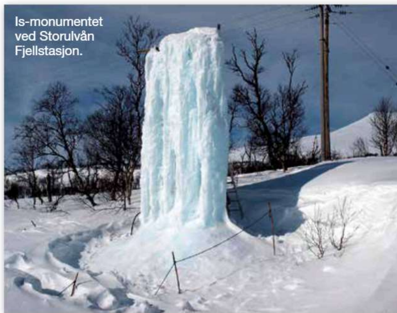
Is-monumentet ved Storulvån Fjellstasjon.