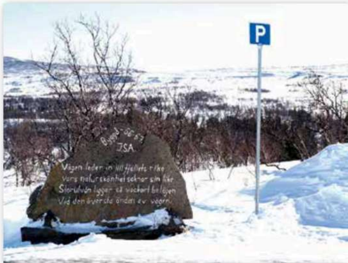
Over: På en av parkeringsplassene står denne stenen som er «bauta» over når denne fjellveien ble bygget.