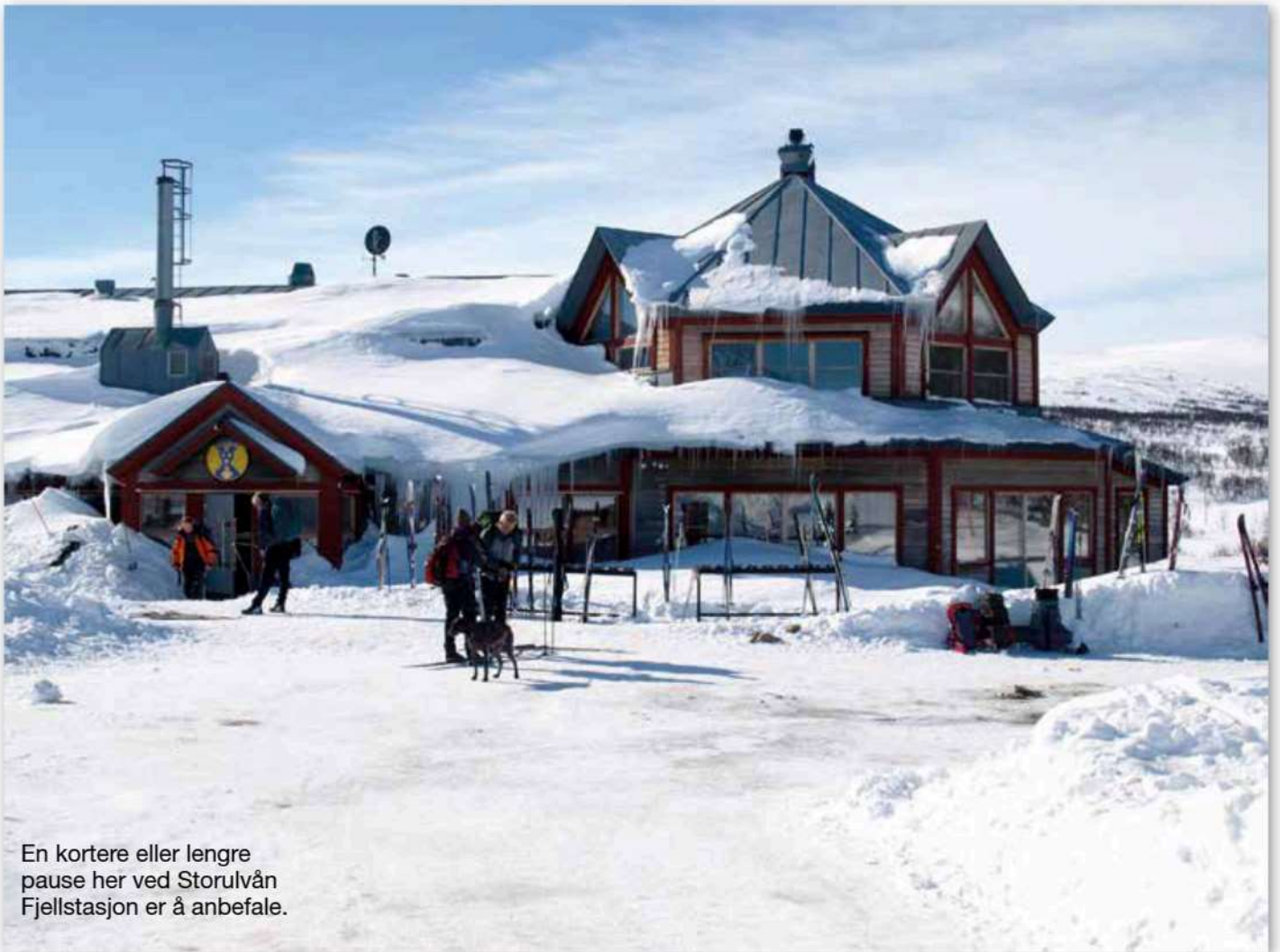
En kortere eller lengre pause her ved Storulvån Fjellstasjon er å anbefale.