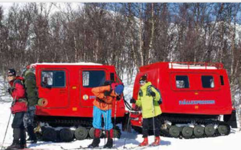
Ønsker du deg en avslappende tur i motbakkene opp til Sylstasjonen så må du booke den med Fjellexpressen. Nedover er det vind i håret og lett å ferdes.

Orker du ikke tanken på å gå langt og lenge, så kan du booke deg billett med Fjellexpressen, da får du skyss oppover. Ta så natta her like oppunder Storsylen og ta de artige unnabakkene ned til bobilen neste dag. Nå er det heller ikke nødvendig å ta steget fullt ut og ta leia mot Storsylen, for rundt Storulvån er det masse muligheter for både lengre og kortere turer, og du er midt i hjertet av terrenget. En tanke til kan være, når du først er ved turisthytta, la bobilkokken få en fristund og spander på dere en lunsj her.