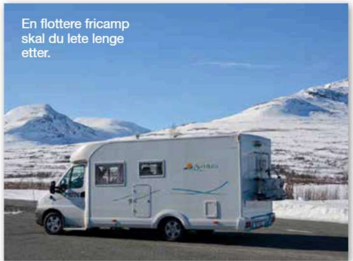
En flott fricamp skal du lete lenge etter.