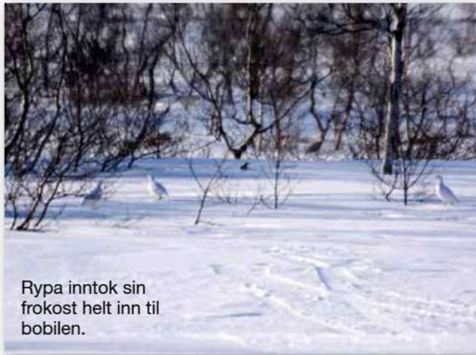
Rypa inntok sin frokost helt inn til bobilen.