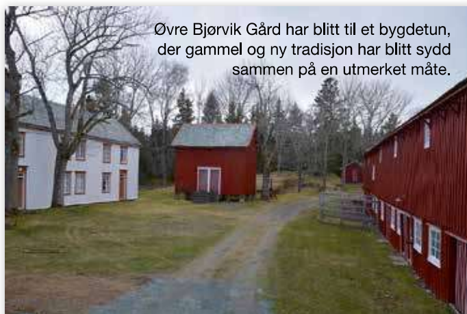
Øvre Bjørvik Gård har blitt til et bygdetun, der gammel og ny tradisjon har blitt sydd sammen på en utmerket måte.