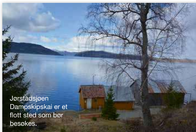
Jørstadsjøen Dampskipskai er et flott sted som bør besøkes.

av Ytterøyas høyeste topper som mål. Turmål finnes det forresten mange av, og likeså turstier, vi valgte Bølåskammen. Den rager ikke mere enn 209 meter over havet, men ga oss en flott oversikt over både land, sjø og nabobygdene. Starten på den turen er enkel å finne. Kjør mot Nordvika, og se etter 10 på toppskiltet. Turen fra parkeringa og opp tar sånn rundt en halv time, og underveis er det flere utsiktspunkter. Likevel er det først når du når toppen av Bølåskammen at du virkelig får utsikten. Her er det både benker og en enkel bål plass. Hva bål angår, så vil vi advare om åpen ild her i tette skogen med tørr mose. Det anbefales å ta med seg litt niste og godt drikke, det er jevn stigning hit, så litt svette underveis må nok påregnes. Men turen anbefales på det sterkeste.