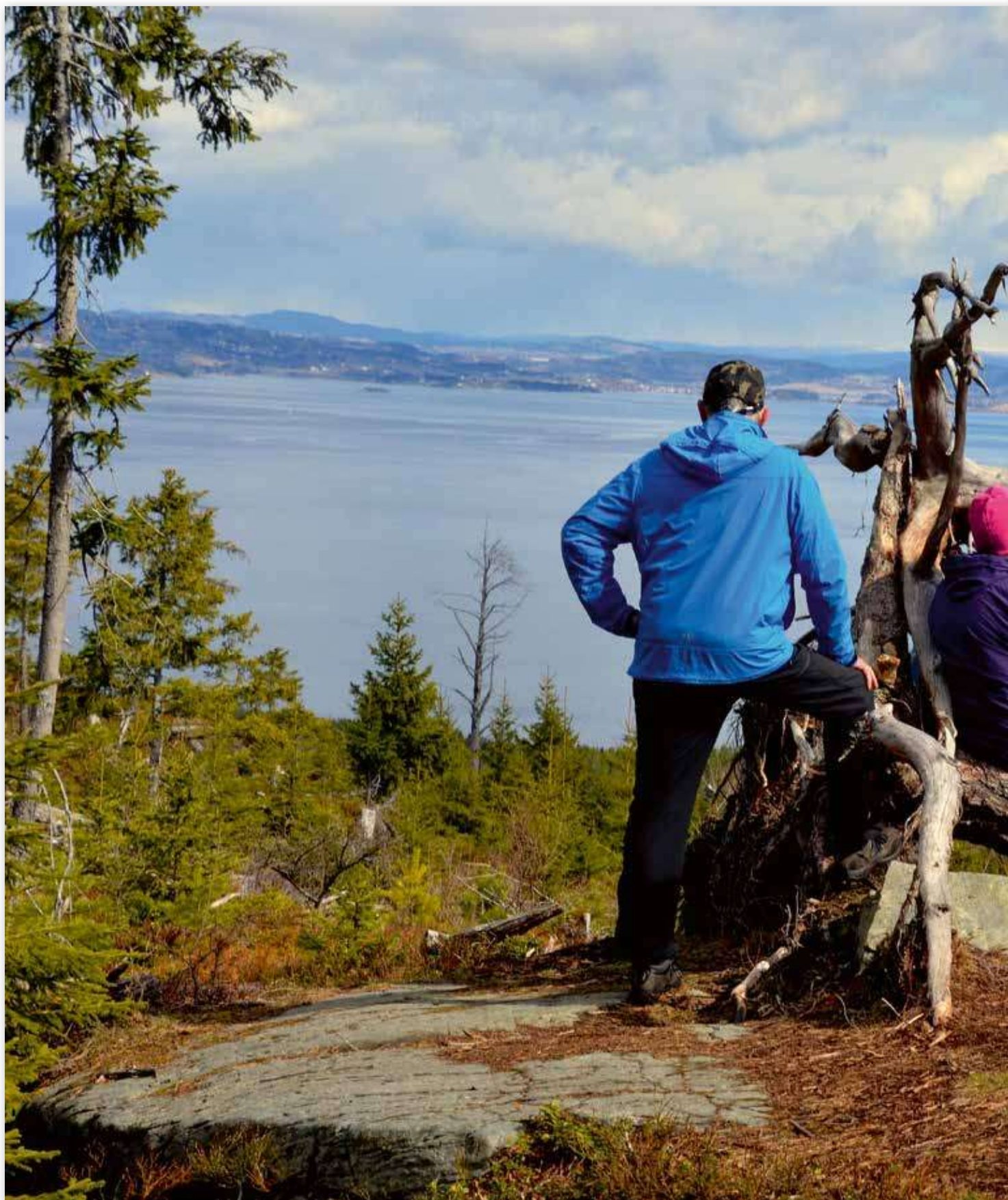
På Bølås-kammen fikk vi en storslagen utsikt, her nord-østover, mot Beitstad, Vangshylla og Skarnsundbrua.