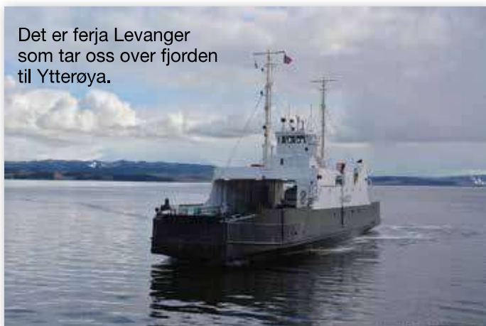
Det er ferja Levanger som tar oss over fjorden til Ytterøya.