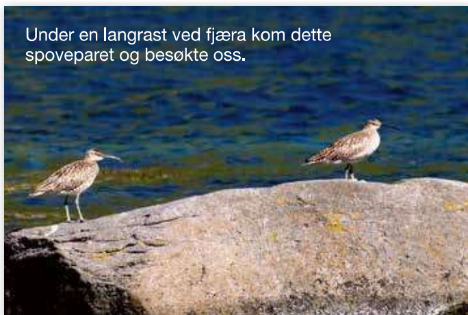
Under en langrast ved fjæra kom dette spoveparet og besøkte oss.